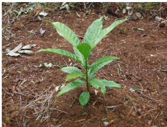
Figura 2. Plántula de Canistel lograda por siembra vía directa en microterraceza de plantación mejorada.

insectos del suelo que al no tener su dura corteza consumieron parte de las mismas; no obstante, se ubicaron 21 plantas más moteadas con cepellón, por lo que se pudo incrementar la población con 27 nuevos individuos, lo que representa un incremento de la población vestigial de un 245,4 % (Figura 2). Para ello, se consideró una aplicación de medidas de Adaptación basada en Ecosistemas (AbE) en un sistema agrosilvo-pastoril; en este caso es conservación de la agrobiodiversidad, con el propósito de conservar un importante recurso fitogenético (RFG) y así potenciar su utilización para la alimentación humana y animal.