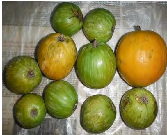
Figura 3. Frutos redondos de canistel verdes y maduros.

Los frutos muestreados en esta investigación fueron todos redondos (Figura 3), ya que es muy variable en forma y tamaño, puede ser casi redondo, con o sin un ápice agudo o pico curvo, o puede ser algo ovalado, ovoide o en forma de huso. A menudo sobresaliente por un lado y tiene un cáliz de cinco puntas en la base que puede ser redondeado o con una depresión distinguible Catalogue of Life (2011).