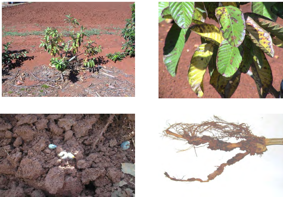
Figura 1. Afectaciones encontradas en el diagnóstico de campo en la Finca Sierra Maestra”.

debe realizarse cada seis meses (Figura 2).