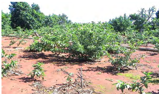
Figura 3. Estado de la plantación de guayaba en asocio con aguacate afectadas por coleópteros y fitonematodos. A: antes. B: después de tratada.