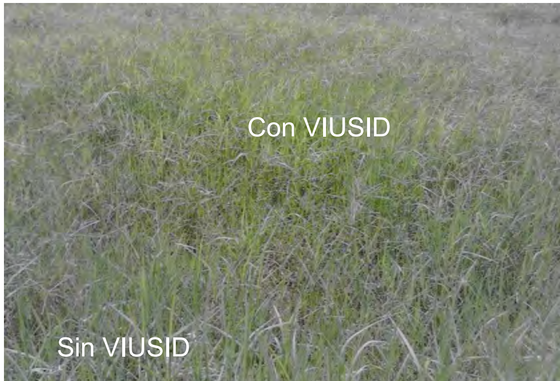
Figura 2. Parcela de Bermuda 'Tifton 85' con y sin la aplicación de VIUSID® agro.

En la Figura 2 se observa una parcela experimental que muestra en el área formada por las plantas tratadas un verdor intenso, mejor vigor y cubrimiento en el césped.